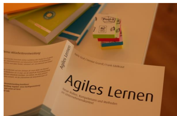
Mentus GmbH, Braunschweig www.mentus.de